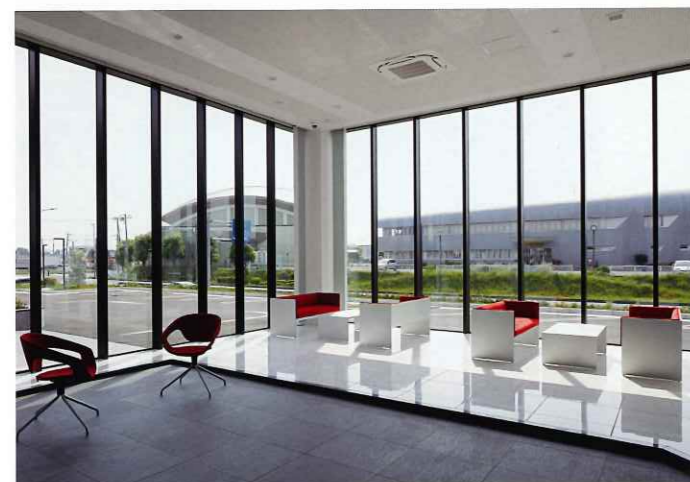
工場のエントランスホール。海外からの視察も多く、ゆとりある空間とした※

所在地 埼玉県東松山市大字宮鼻 860-12 建築主 AKIM 株式会社 用途 機械製作工場 定員 100名 設計担当 設計監理：VIT 黒澤亮、中田哲寛 開発：東建企画設計 野口健吉 構造設計：[本社屋] JFEシビル 入川英二 [守衛所、車庫、倉庫、研修センター] VIT 黒澤亮 設備設計：山崎設備設計 山崎純悟、鹿野大貴、越田志保、西澤一夏 施工 建築：島村工業 電気：中村電設工業 空調・衛生：ソーセツ 構造・規模 工場：S造 地上3階 車庫：S造 平屋 守衛所、倉庫、研修センター：W造 平屋 敷地面積 9,971.71㎡ 延床面積 4,686.02㎡ (工場、守衛所、車庫、倉庫、研修センター) 竣工 2018年8月