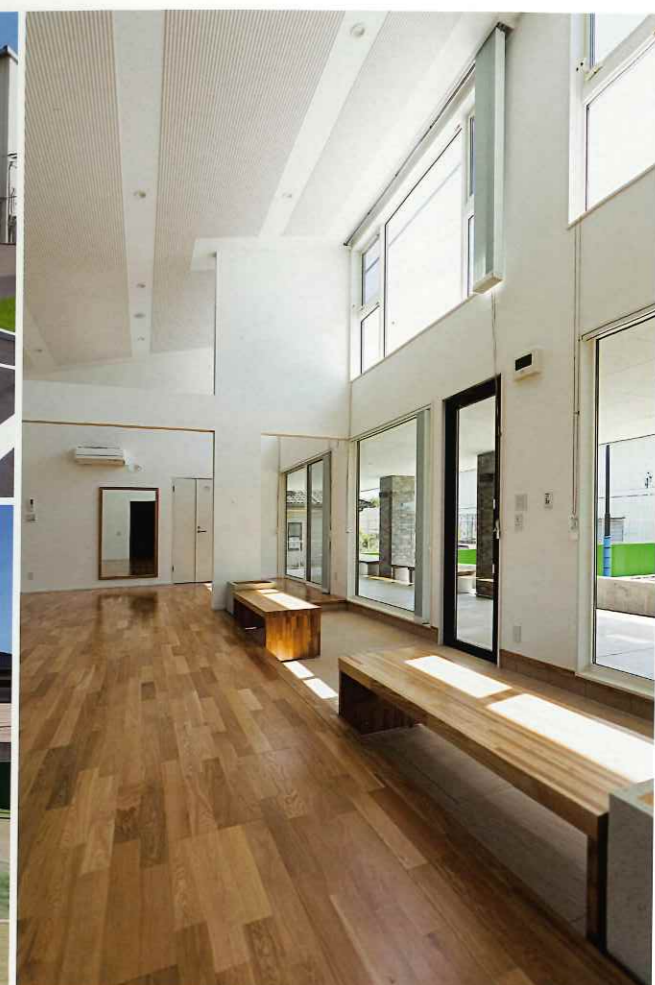
研修センター。社内研修だけでなく、さまざまなレクリエーションの起点となるスペース