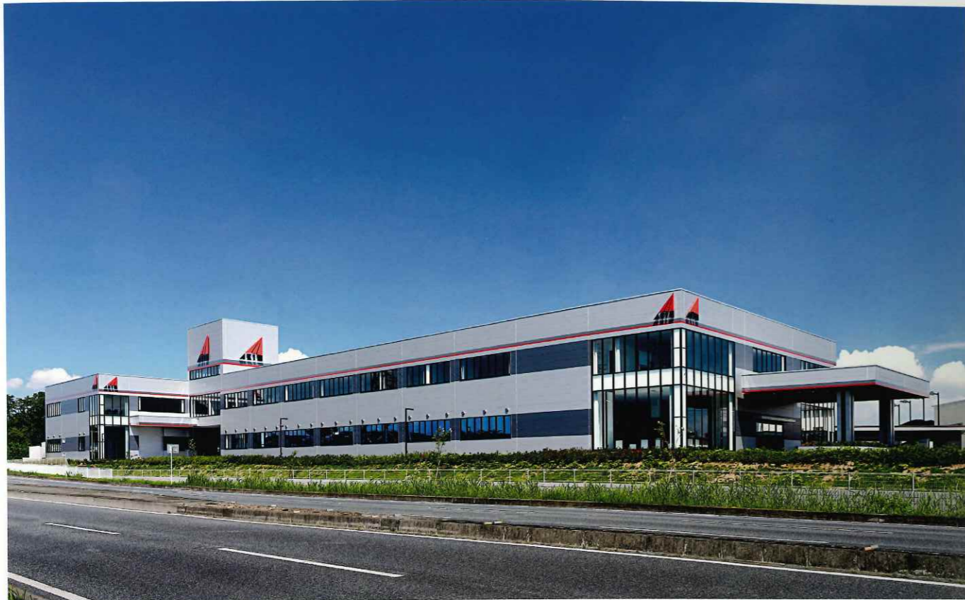
工場外観。奥側に田園の風景を臨む豊かな環境に立地している