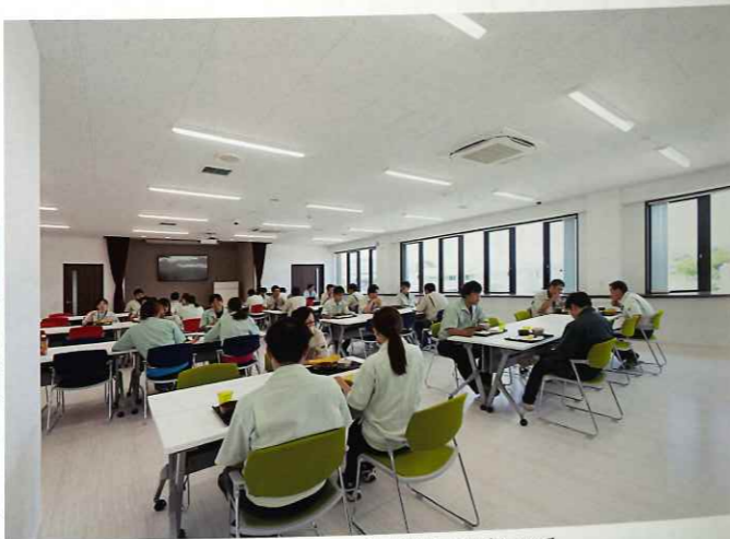
食堂。工場内に設けられた食堂と厨房施設により健康管理にも配慮している