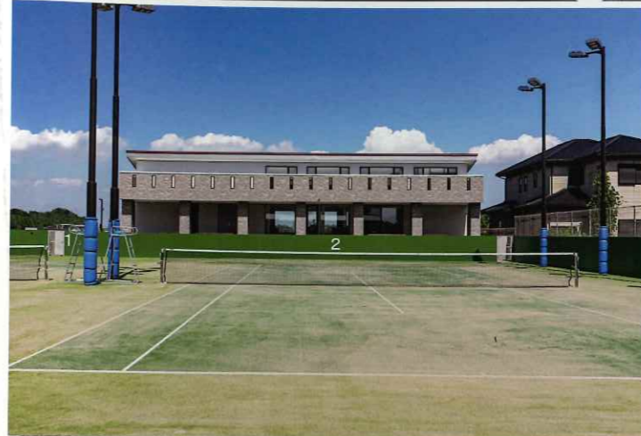
上 | ゲート。手前は守衛所 下 | テニスコートと研修センター。仕事が終わった後に練習できるよう照明設備も充実している