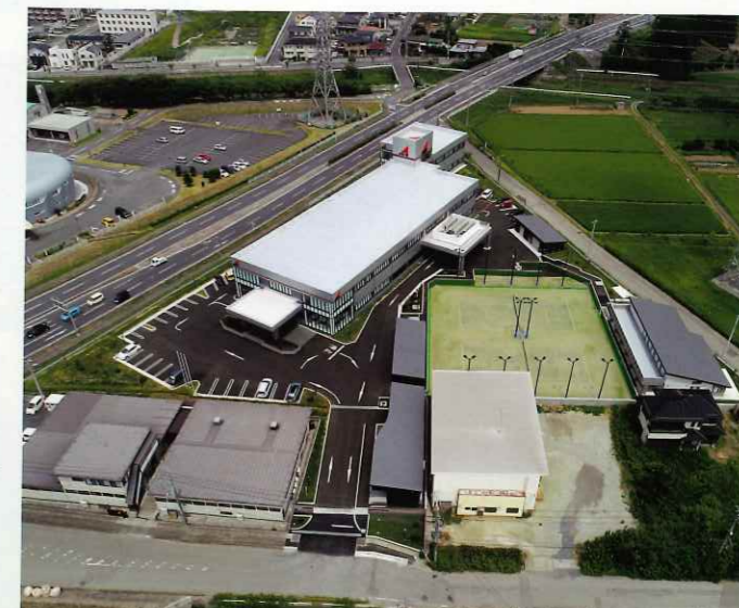
三角形の変則的な敷地に、各種機能が有機的に連携できるように配置した※※